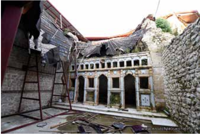
Die zerstörte Kirche Aya Yorgi im Stadtteil Sarilar Altinözü in Hatay.