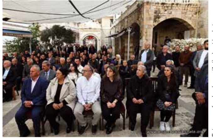
Gottesdienste finden unter freiem Himmel statt, weil die Kirchen zerstört sind.

Der Zentralrat bemüht sich aber nicht nur um den materiellen Wiederaufbau vor Ort. Es geht auch um direkte