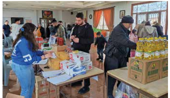
Das Team der Franziskaner und die vielen Gäste beim Osteressen in Aleppo.