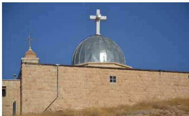
Kloster der Heiligen Sergios und Bacchus in Malula/Syrien

In der Maronitischen Kirche sind viele Gotteshäuser nach den beiden Heiligen benannt und es gibt ein Gebet, in dem sich die Gläubigen an die beiden Märtyrer richten, mit der bitte, für sie Fürsprache bei Gott einzulegen: „Heilige Sergios und Bacchus, da ihr Jesus geliebt und vor Königen und Statthaltern Zeugnis für ihn abgelegt habt, indem ihr aus Liebe zu ihm euer Leben gegeben habt, bitten wir euch, für uns zu beten, dass auch wir Jesus lieben und vor allen Menschen durch unser Handeln und unsere Worte Zeugnis für ihn ablegen.“