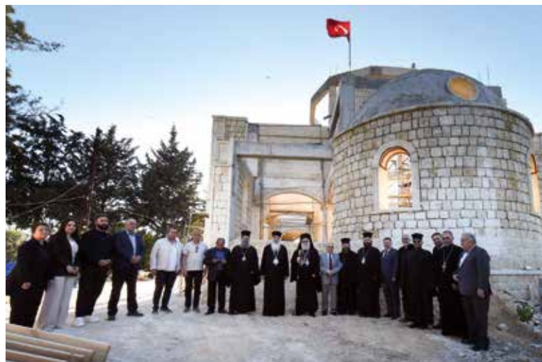
Lokalausgleich von Patriarch Johannes X. beim Kirchenneubau in Sarilar Altinözü in Hatay.